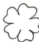
bloem 6 x

© Dit patroon krijg je gratis van Atelier Pippilotta.